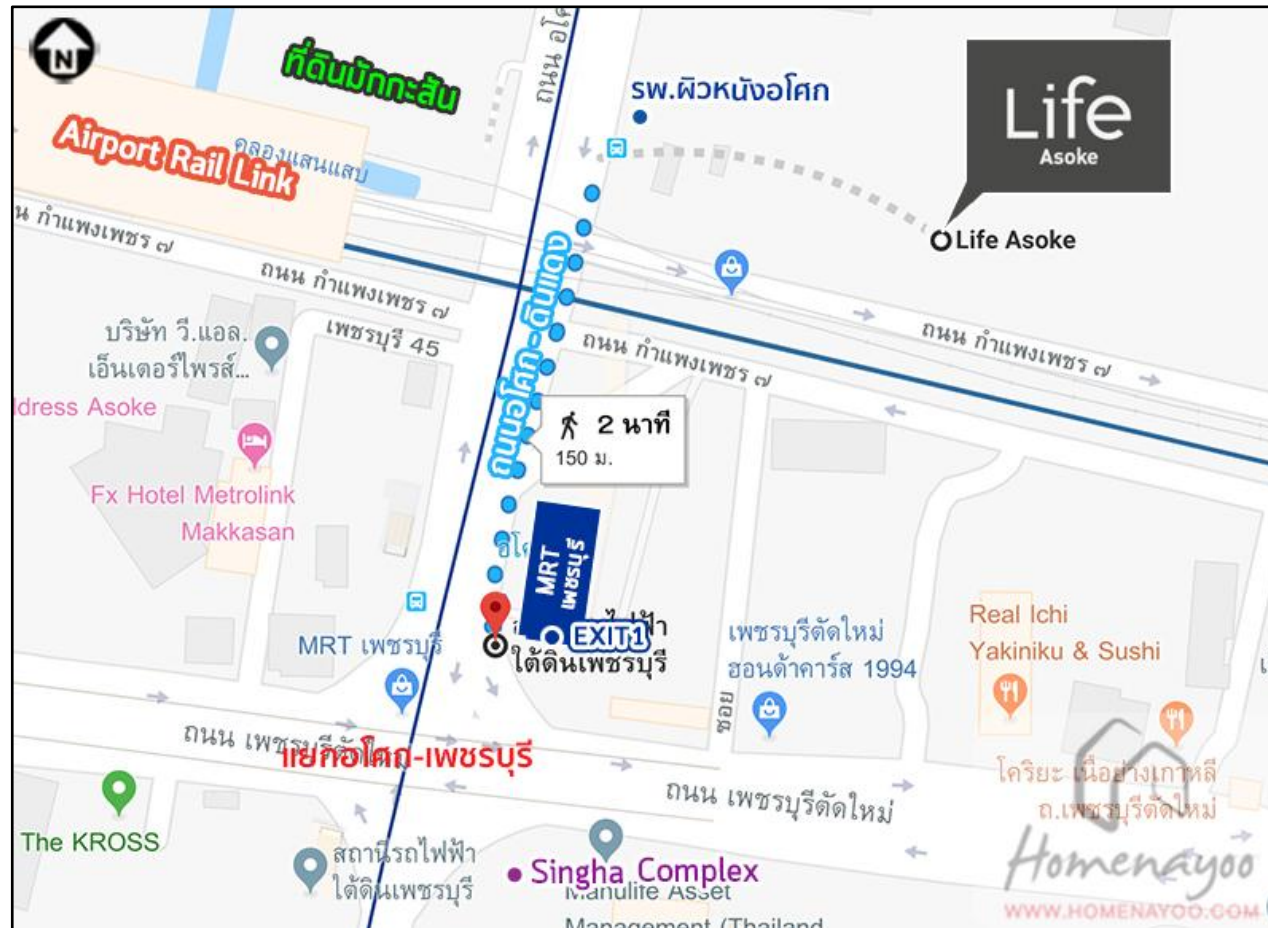
รูปที่ 1.2 แผนที่สังเขปแสดงที่ตั้ง โครงการอาคารชุด Life Asoke (ไลฟ์ อโศก)